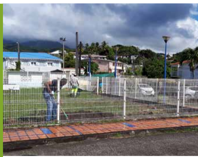
Terreville : Réhabilitation du jardin d'enfants