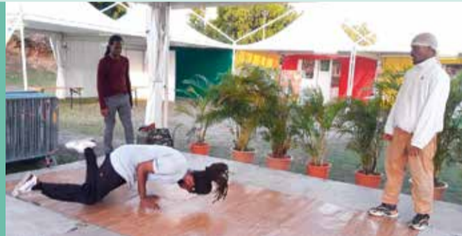
La compagnie de danse « Zion Be Boys » a présenté plusieurs aspects du Hip Hop.