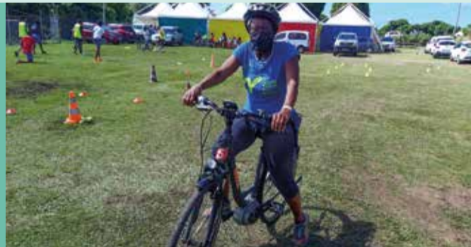
Le concept sportif « An ti moman plézi » mis en place par la Direction des Sports, a permis la découverte de nouvelles activités comme la pratique du vélo électrique.