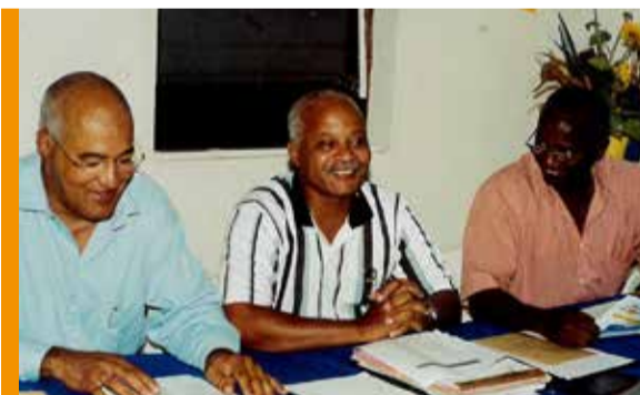
Militant, il était l'un des co-fondateur de Vivre à Schoelcher