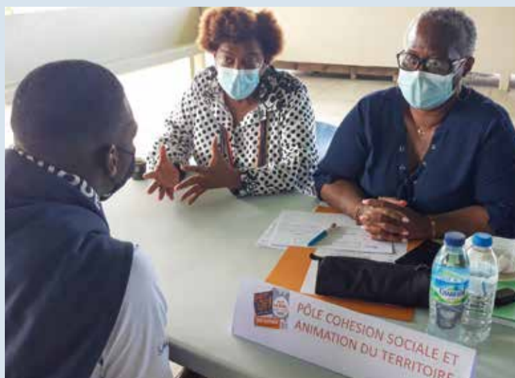
La ville de Schœlcher a été le principal recruteur de ce job dating avec 13 offres (emploi d'agents de restauration, de responsables de structures d'accueil collectif de mineurs (ACM), des postes dans le social et dans l'accompagnement de l'accès au droit.

Une soixantaine de jeunes de moins de 26 ans sont venus à la rencontre de potentiels employeurs. Cette action PEC, (Parcours Emploi Compétence), intervient dans le cadre du plan « Un jeune, une solution » mis en place par l'Etat depuis 2020 et a pour but de favoriser l'emploi et l'insertion des jeunes de 16 à 25 ans. Deux types de contrats aidés sont proposés. Le Contrat Initiative Emploi (CIE), en CDD de 9 mois ou CDI s'applique au secteur marchand. Le Parcours Emploi Compétences (PEC), en CDD de 11 mois ou CDI, est quant à lui destiné au secteur non marchand. Les 60 candidats du jour ont eu l'opportunité de présenter leurs compétences, d'afficher leur motivation devant les recruteurs présents à savoir, Ville de Schœlcher, la société Display (spécialisée dans l'animation commerciale pour la grande distribution), l'Union des Parents d'Élèves de Martinique (UPEM) qui à sa charge les animateurs périscolaires et le CFA pour les formations artisanales (boucherie, pâtisserie, BP commerce).