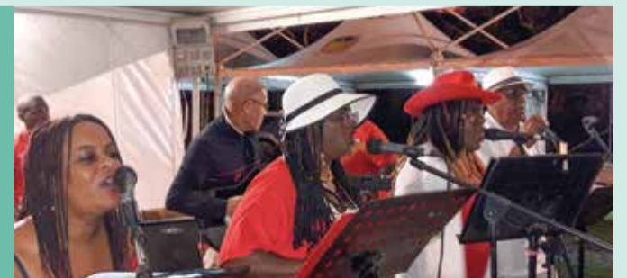
Le groupe Yon Di Yo a entonné quelques ritournelles pour nous mettre dans l'ambiance de Noël.