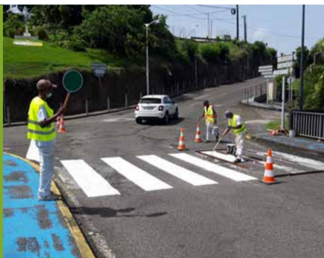
Marquage des signalisations routières