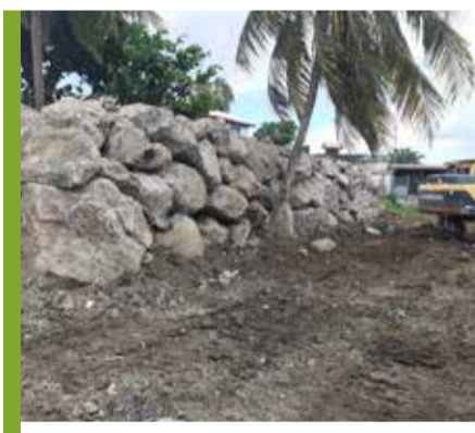
Saint Georges : Enrochement en préparation de la pépinière de transplantation