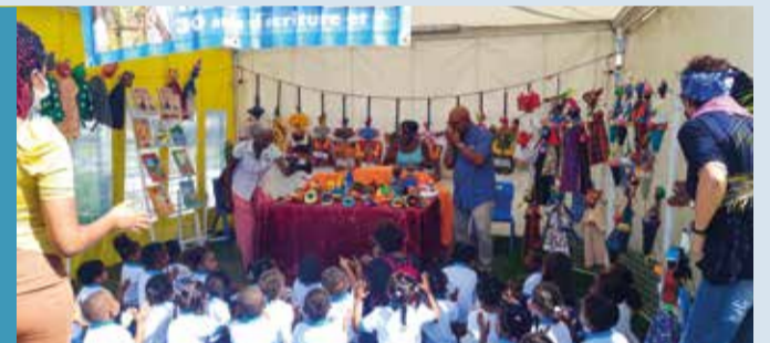
La caravane des quartiers est aussi ouverte aux scolaires notamment avec des spectacles de marionnettes, des expositions et des films documentaires.