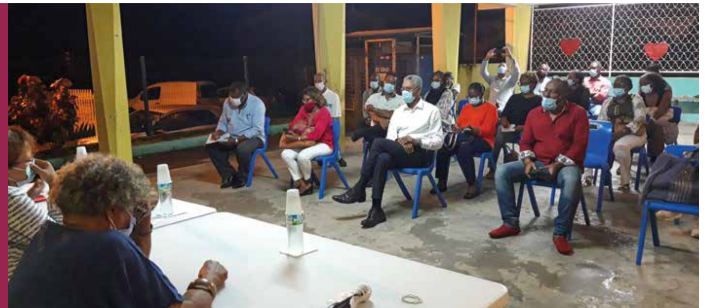
Plusieurs réunions publiques ont été organisées pour recueillir l'avis et les idées de la population pour le travail sur la mémoire des quartiers

Comment organiser et faciliter sur notre territoire, les conditions, les modalités des expressions diverses et multiples, culturelles et identitaires en lien avec notre histoire personnelle, communale, martiniquaise dans la construction de notre citoyenneté et de notre Humanité ? Comment articuler le passé au présent, assurer les conditions, de la filiation, de la transmission, du devoir de mémoire ? Comment jeter les bases de la consolidation sociétale et de l'élaboration du futur comme espace de convergence, de développement et de continuité ? Ce sont autant de questions sur lesquelles les membres de la Commission se sont penchés lors de leurs séances de travail mensuel. Bien entendu, ces préoccupations majeures et communes à tous sont au cœur du projet politique de la ville. Pour y répondre, la ville, via notamment son Service Culture, offre de manière continue un dispositif permanent et régulé de manifestations, de conférences, un système d'éducation ouvert sur le monde, des postures sociales, citoyennes et intergénérationnelles. La Caravane des quartiers est une des réponses opérationnelles en lien avec les préconisations des experts de la Commission Mémoire.