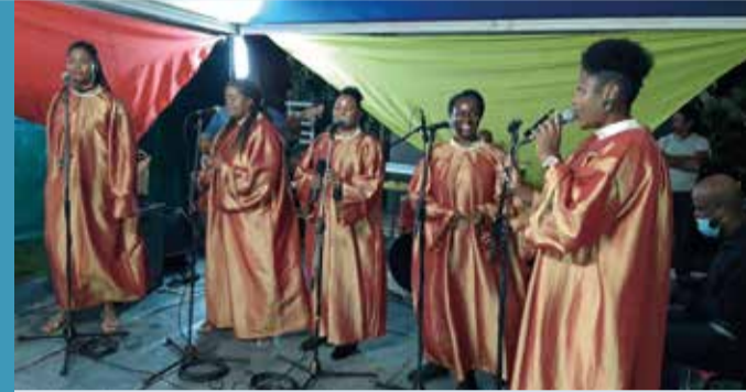
Le groupe Total Praise est embarqué dans la Caravane. Il fait chanter et danser au rythme du gospel.