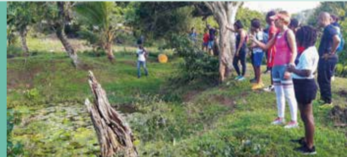
Une randonnée découverte a permis de découvrir les mares qui font la réputation du quartier.