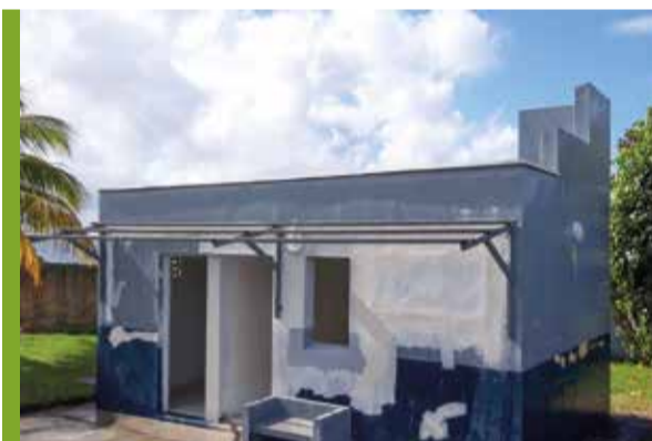
Terreville : Rénovation des toilettes du cimetière