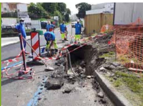
Cluny : Reprise du réseau d'eau pluviale rue Félix Eboué