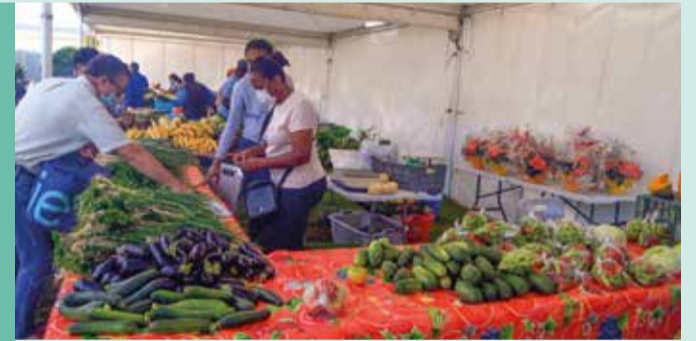
Vif succès pour le marché de Noël de l'association Dynamic Club et du syndicat des agriculteurs.