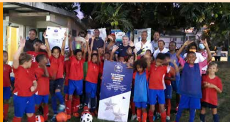
Remise du label par la FFF