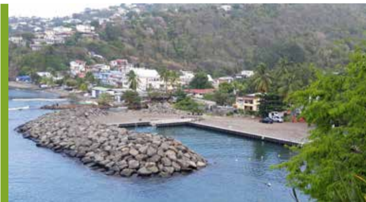
Fond Lahayé : la 1 ère phase des travaux de l'Aménagement pour la Pêche d'Intérêt Territorial concernant la construction et la protection de la digue ainsi que de la rampe de mise à l'eau est achevée. La prochaine étape est la finalisation de la plateforme avant l'installation des superstructures par la CTM.