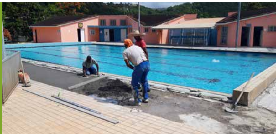
Travaux de rénovation de piscine 1 ère phase : installation d'une nouvelle clôture, de nouveaux garde-corps, d'un éclairage à Led à l'intérieur et à l'extérieur du bassin et mise en place d'un système anti-intrusion. 2 ème phase : revêtement partiel du bassin, de la plage et l'entrée du bâtiment, peinture et étanchéité

Terreville : 13 chemin Petit Bois Fond Bernier : Rue des Myrtacées