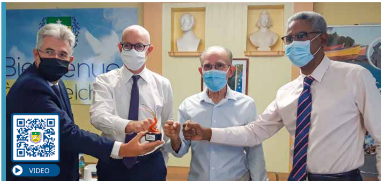
Cérémonie de remise des travaux avec le préfet et le président de C exécutif

Cette opération résulte d'une convention quadripartite entre Orange Caraïbes (constructeur réseau), la ville, l'Etat et la CTM. Elle permet dorénavant aux entreprises et aux particuliers de bénéficier d'une connexion très haut débit, plus rapide en émission comme en réception et ce, sans aucun coût pour le contribuable. Aujourd'hui, ce sont au total plus de 12 000 prises qui ont été installées sur l'ensemble de la commune.