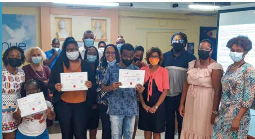
Les bénéficiaires du Passeport Numérique Jeunes Schœlchérois

Au mois de décembre, à l'issue de la formation, chacun des participants s'est vu remettre un ordinateur portable.