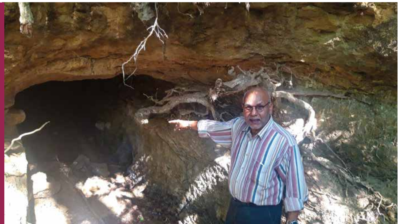
Le tombeau des Anglais est un site chargé d'histoire que la ville entretient dans cette démarche de devoir de mémoire.