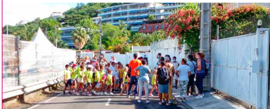
400 élèves des écoles de maternelle et primaire de l'Anse Madame A et B ont pris part à l'exercice, chapoté par le Service Sécurité/Risques Majeurs de la ville.

Dans le cadre des journées REPLIK 2021, la ville de Schœlcher a procédé à un exercice d'évacuation de la zone de la vallée de Case-Navire entre le rond-point des écoles et la déchetterie.