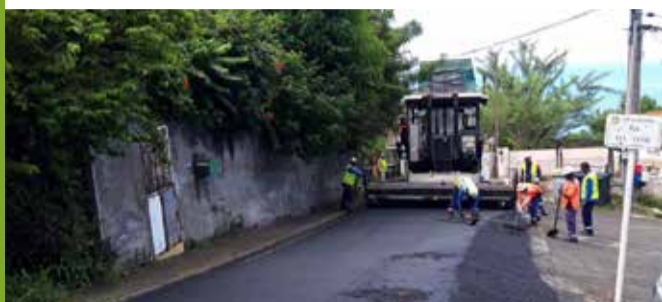
Quartier : rue Huraut de Manencourt / Bourg : rue des Collégiens, reprise d'un ralentisseur de type dos d'âne, rue de l'église, rue Michel Alexandre / Ravine Touza : portion de route sur la voie principale / Terreville : Chemin Petit-Bois / Anse-Madame : rues Lionel Paviot et Simon Cottrell