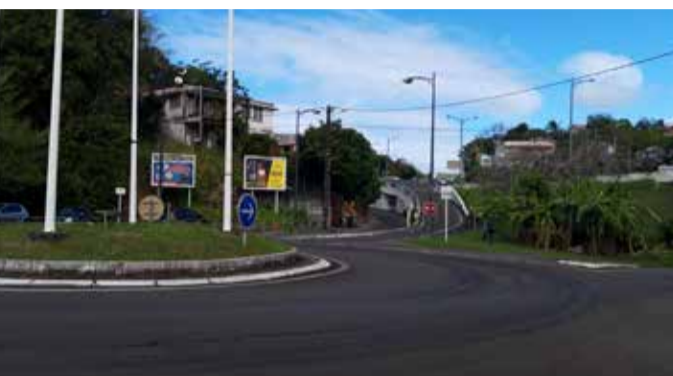
Anse Collat : Rue Caplaous / Madiana : Avenue de Madiana Enclos : Rue Gérard Labrador