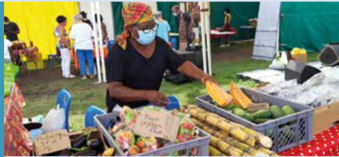
Le mini marché avec les cultivateurs de Schœlcher est un produit d'appel de la caravane.