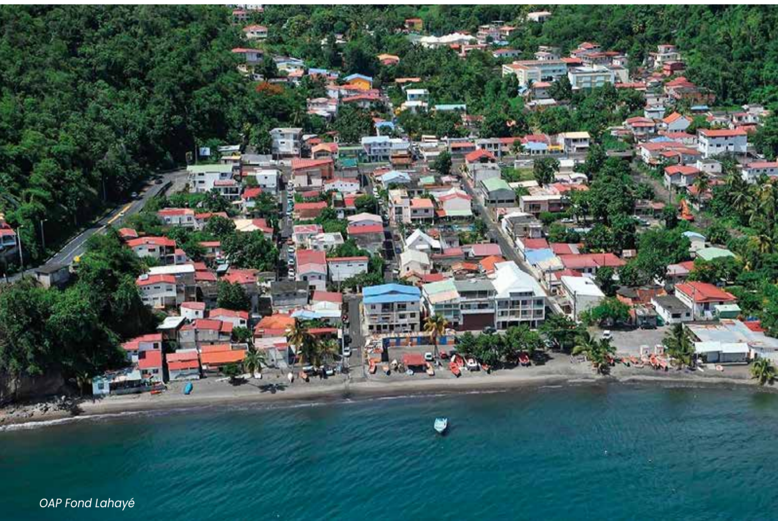
OAP Fond Lahayé

Avec cette révision, c'est non seulement un projet de ville qui a été approuvé ; mais surtout un projet de vie qui voit sa faisabilité renforcée. Ce nouveau PLU (révisé) se veut un outil ajustable au regard de l'évolution de notre territoire (démographie...) et à la nécessaire préservation de l'environnement.