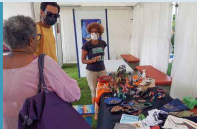
Les associations An ba bwa art (collectifs d'artistes) et Saint-Georges de Batelière se sont largement impliquées dans l'organisation de la manifestation.