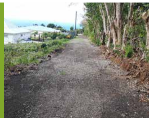
Démarche : Reprofilage du chemin Clausel