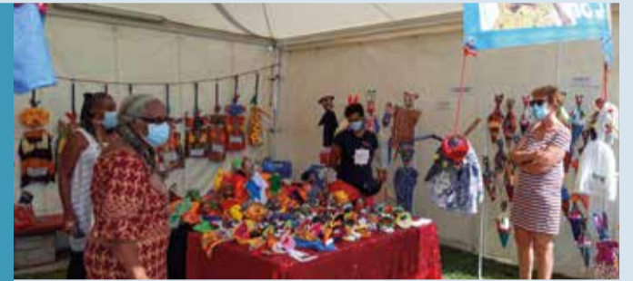
La marionnettiste présente ses créations pour le plus grand plaisir des petits et des grands