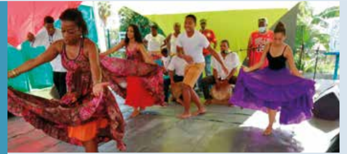
La tradition à l'honneur durant toute la caravane avec des ateliers et des rondes Bèlè.