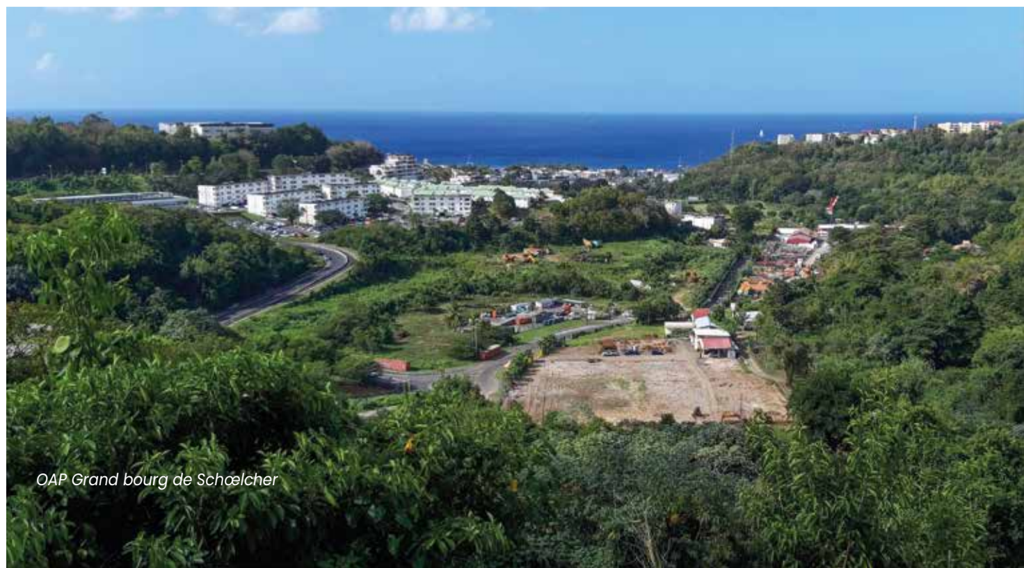
OAP Grand bourg de Schœlcher

Le littoral de Fond Lahayé fera l'objet d'une revalorisation avec la création d'un espace public aménagé couplé à un parking, et la création de l'APIT (Aménagement Portuaire d'Intérêt Territorial). L'identification de linéaires commerciaux de part et d'autre de la RN2 et le long du littoral permettra de valoriser les activités économiques existantes et de préserver les commerces d'éventuels changements d'usage. Les espaces verts seront aménagés de part et d'autre de la RN2 pour en limiter les nuisances sonores et visuelles.