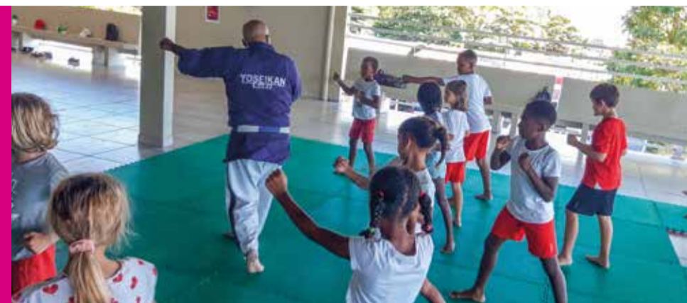
Le Yoseikan Budo est un art martial japonais qui relie l'Aïkido, le karaté, le judo, la boxe anglaise et les arts de combats avec armes. C'est une pratique pluridisciplinaire qui donne l'impression aux enfants de faire plusieurs activités en même temps.

« Karaté at School » est un programme initié depuis janvier 2021 par la Fédération Française de Karaté (FFK) et relayé chez nous par la ligue de Karaté de Martinique en partenariat avec l'ARS, La DRAJES, l'ANS (Agence Nationale du Sport) et la FFK.