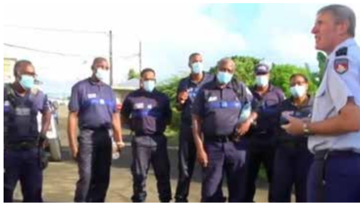
Les policiers municipaux de Schœlcher en formation pour mieux lutter contre la délinquance.