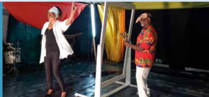
Le « Tribunal des femmes bafouées » de Tony Delsham, mis en scène par José Alpha, n'a pris aucune ride tant son sujet sur la violence faite aux femmes est d'actualité.