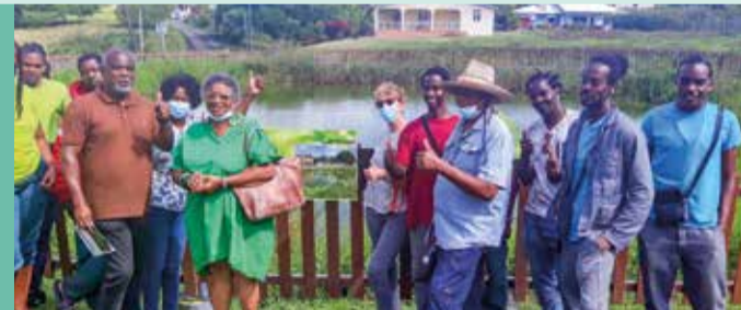
Les jeunes en insertion à travers le programme « Bel' Démarche » de l'AMISOP (Association Martiniquaise pour l'Insertion Sociale et Professionnelle) sont fiers de présenter leur travail de protection et de valorisation des sites de Démarche, tel que les mares.