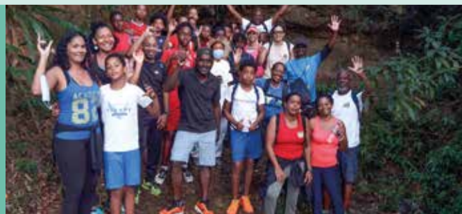
Les randonneurs ont pu découvrir le fameux « Tombeau des Anglais », vestige de l'époque coloniale en Martinique.