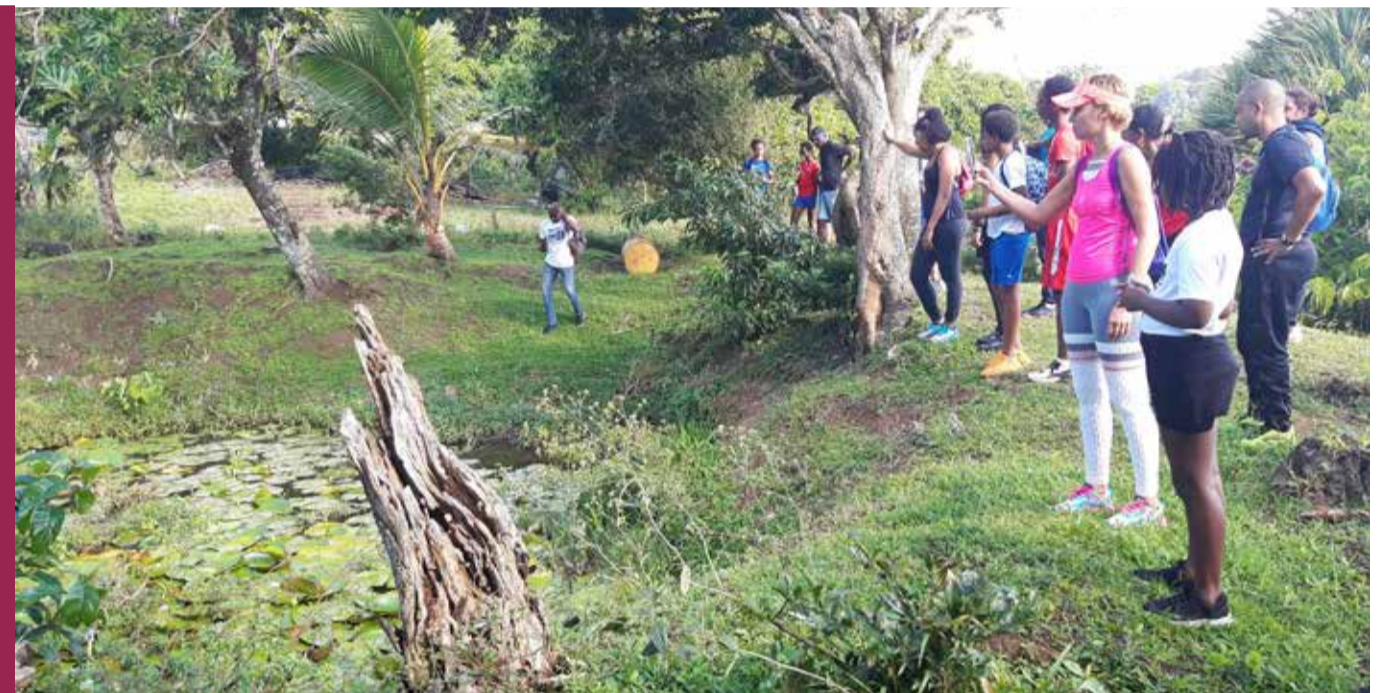
A l'occasion de la caravane des quartiers, une randonnée pédagogique était proposée autour des mares de Démarches