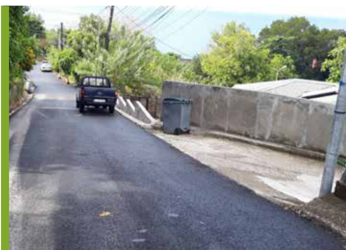
Muret rue Caplaous : Mise hors d'eau partielle, rue Caplaous à Anse collat (réalisation d'un muret au droit de la parcelle T-1387)