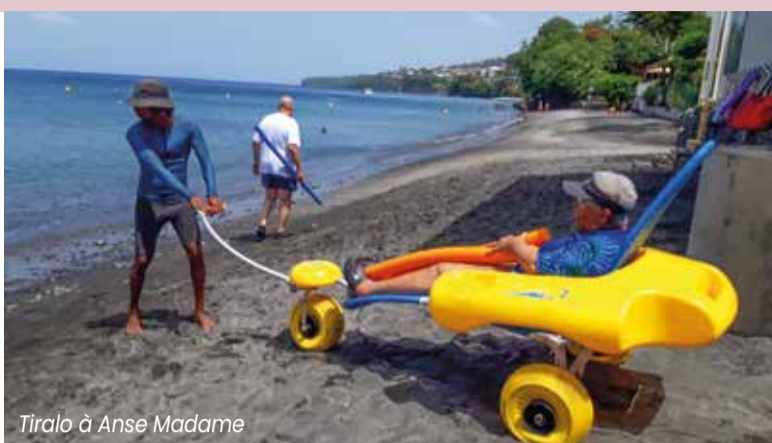
Tiralo à Anse Madame