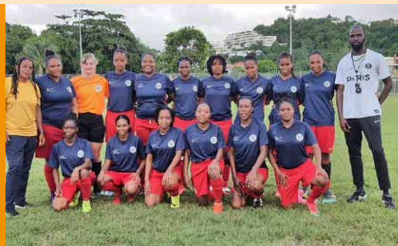
Équipe féminine de l'Émulation

Cette distinction nationale, valable pour 3 ans, récompense la qualité du travail d'une quinzaine d'années de toute l'équipe d'encadrement du club ainsi que l'implication des parents dans la réussite du club. Hormis l'équipe sénior, près de 25 filles sont licenciées au club. Elles ont été finalistes de la Coupe de Martinique pour la saison 2019-2020. Cette année, avant l'arrêt des compétitions pour cause de crise sanitaire, l'équipe était déjà classée à la 4 ème place du championnat.