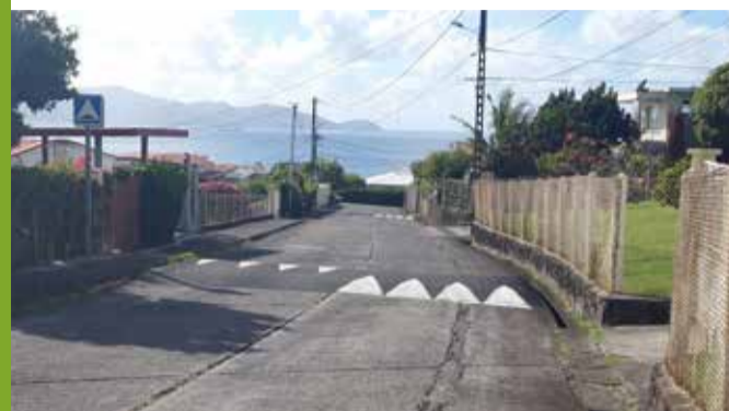
La Colline : rue principale / Anse Gouraud : rue de l'école Hôtelière / Terreville : Avenue Bois-Rivière