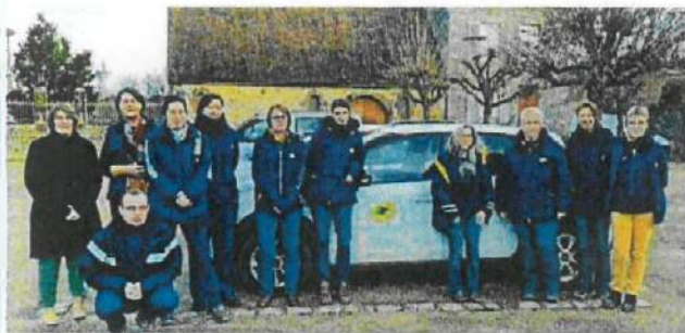
Cinq nouveaux à Fresnay-sur-Sarthe. Huit agents de La Poste seront chargés du recensement pour la commune de Fresnay.

La campagne de recensement se déroulera du 19 janvier au 18 février dans la commune nouvelle de Fresnay-sur-Sarthe. Elle sera assurée par huit agents de La Poste.