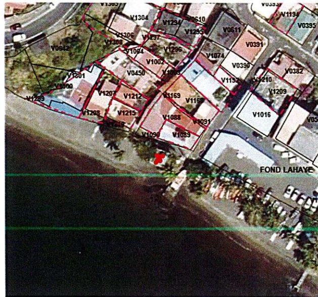
Figure 1: Plan de situation : le carbet est repéré par la croix rouge